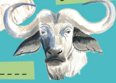
Le b _ _ _ _ _