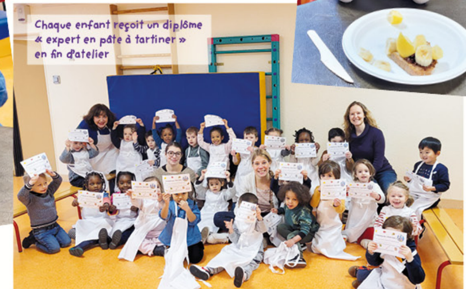
Chaque enfant reçoit un diplôme « expert en pâte à tartiner » en fin d'atelier