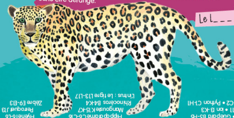
Le l _ _ _ _ _

Je m'adapte facilement à tous les environnements : savane, forêt, montagne ou même désert. Comme beaucoup d'autres félins, je préfère dormir le jour et me déplacer la nuit. Mon habitat se résume souvent à une grosse branche d'où je peux guetter mes proies ou faire une bonne sieste sans être dérangé.