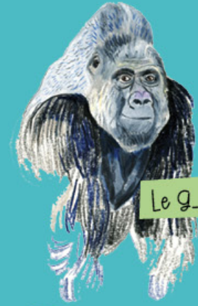
Le g _ _ _ _ _

Cherche l'intrus dans la grille Mais que fait-il là ? L'un d'entre eux n'a jamais mis le nez en Afrique. Ce grand félin que l'on reconnaît à sa fourrure rousse rayée de noir vit dans plusieurs pays du continent asiatique, de l'Inde jusqu'en Sibérie où les températures, l'hiver, sont glaciales. Le climat africain n'est pas du tout fait pour lui.