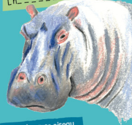
L'h _ _ _ _ _

Je suis le plus gros oiseau de notre planète. Dans ma famille, les mâles peuvent mesurer jusqu'à 2,75 mètres de haut. Mes plumes sont immenses mais elles ne me servent qu'à parader car je ne sais pas voler. Pour me déplacer, je cours, et je cours même très vite.