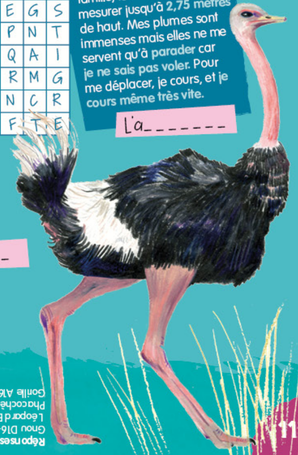
L'a _ _ _ _ _