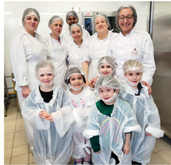
les enfants de la maternelle de Sextius Michel et Péquipe de cuisine de Pécole : une belle rencontre en cuisine

Depuis 3 ans, la Caisse des écoles organise le jeu concours « j'aime ma cantine ». Les enfants expriment à travers un support leur perception de la cantine, aidés par des REV ou des animateurs. Au Forum du Goût de la Caisse des écoles (début octobre), une remise de prix par Monsieur le Maire valorise leur travail. (Découvrez les vidéos et les bandes dessinées réalisées par les enfants les années précédentes sur notre site cde15.fr )