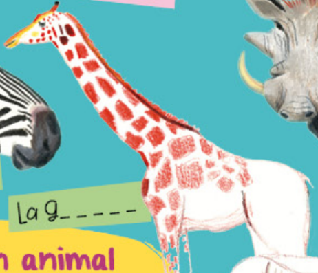
La G _ _ _ _