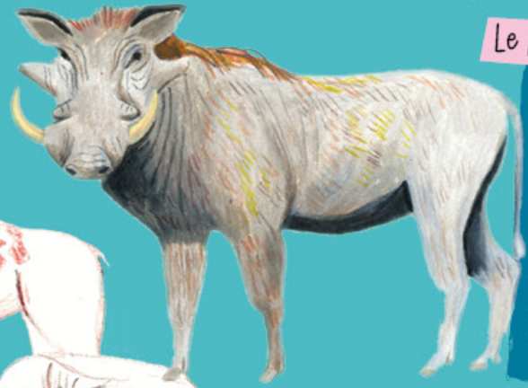
Le p _ _ _ _ _

Comme mon cousin le sanglier d'Europe, j'aime la fraîcheur et l'ombre des forêts. On me reconnaît facilement à mes deux défenses tournées vers le haut. Elles me servent à déterrer les racines et les bulbes dont je me nourris et à me défendre en cas d'attaque.