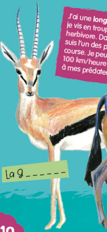
La g _ _ _ _ _

J'ai une longue queue noire, je vis en troupeau et je suis herbivore. Dans la savane, je suis l'un des plus rapides à la course. Je peux atteindre les 100 km/heure pour échapper à mes prédateurs.