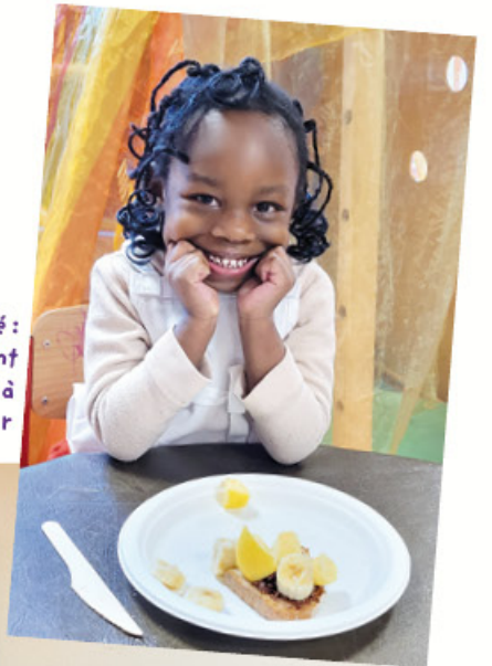
Ecole Cépré : 2 classes ont participé à l'atelier