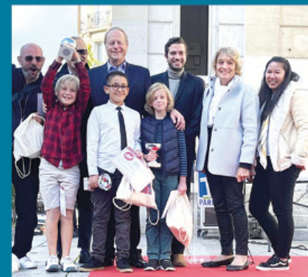
Remise de prix au Forum du Goût 2022

Depuis 3 ans, la Caisse des écoles organise le jeu concours « j'aime ma cantine ». Les enfants expriment à travers un support leur perception de la cantine, aidés par des REV ou des animateurs. Au Forum du Goût de la Caisse des écoles (début octobre), une remise de prix par Monsieur le Maire valorise leur travail. (Découvrez les vidéos et les bandes dessinées réalisées par les enfants les années précédentes sur notre site cde15.fr )