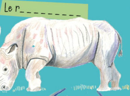
Le r _ _ _ _ _