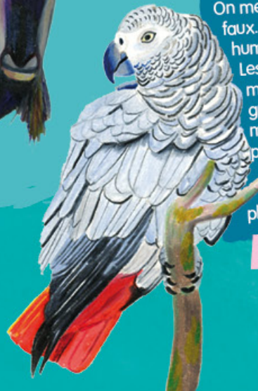
Le p _ _ _ _ _

On me dit bavard, ce n'est pas faux. Il est vrai qu'imiter la voix humaine m'amuse beaucoup. Les forêts tropicales sont mon domaine. J'y trouve les graines et les fruits dont je me régale. Mon gros bec, puissant et coupant, m'aide à les dénicher et à broyer les coquilles les plus résistantes.