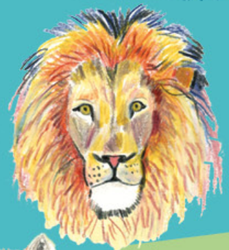
Le l _ _ _ _