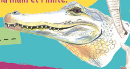
Le c _ _ _ _ _

Je suis le plus gros oiseau de notre planète. Dans ma famille, les mâles peuvent mesurer jusqu'à 2,75 mètres de haut. Mes plumes sont immenses mais elles ne me servent qu'à parader car je ne sais pas voler. Pour me déplacer, je cours, et je cours même très vite.