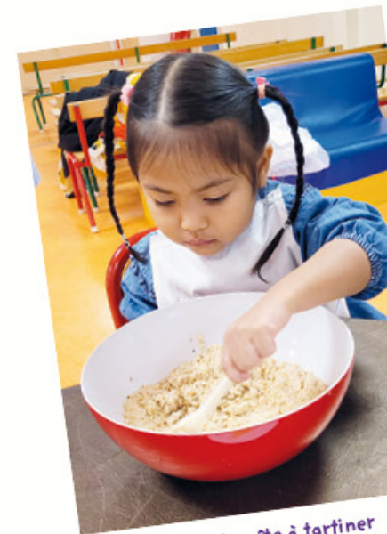
Préparation de la pâte à tartiner

Conçu et animé par la diététicienne de la Caisse des écoles, l'atelier est une initiation à la cuisine (proposé aux directeurs d'école sur le temps scolaire). Concentrés et appliqués, les enfants préparent une pâte à tartiner « maison » puis coupent des fruits frais. Chacun confectionne sa tartine gourmande pour ensuite la déguster : quel plaisir de manger ce qu'on a préparé !