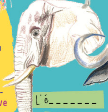
L'é _ _ _ _ _

Devine mon animal est un jeu qui se joue à plusieurs. Chacun à son tour imite un animal que les autres joueurs doivent découvrir. On peut imiter son cri, son aspect, sa façon de se déplacer ou encore son comportement : gentil, affectueux, rusé, imposant, agressif. Les mots cachés de cette grille peuvent accompagner ce jeu. Celle ou celui qui trouve un animal lève la main et l'imité.