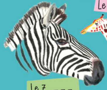
Le Z _ _ _ _

Attention où tu mets les pieds : il y a un grand reptile qui attend ses proies à fleur d'eau, des félins cachés dans les hautes herbes qui guettent le passage d'herbivores dont ils feront leur dîner et de lourds troupeaux lancés à pleine vitesse dans la savane, écrasant tout dans leur course folle.