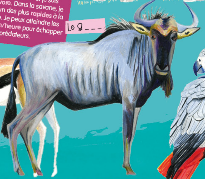
Le g _ _ _ _ _