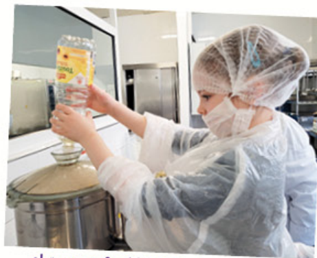
chaque enfant intègre dans le robot un élément de la vinaigrette : de vrais petits chefs !